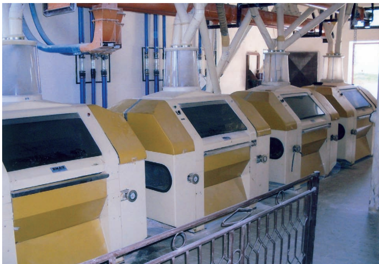
Најсавременија технологија за мељаву пшенице